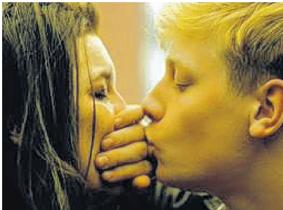
La saison hiver-printemps se terminera avec le film «Mommy».