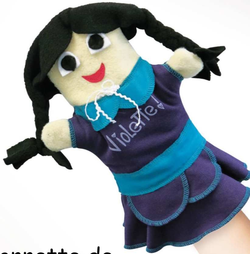
La marionnette de Violette/Violette's Puppet